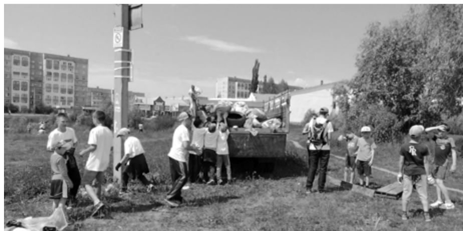
На фото: Юные участники Международного дня очистки водоемов на оз.Светлом погружают собранный мусор в грузовую машину