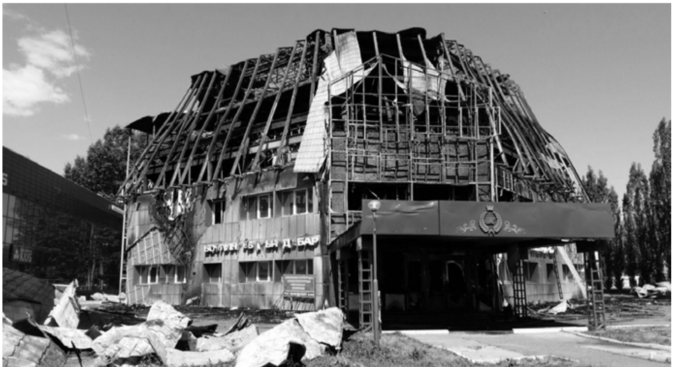
На фото: На утро после пожара здание сгоревшего клуба выглядит удручающе и остается оцепленным полицией

В 22:40 начинается настоящий транспортный коллапс - вся центральная площадь города оказалась заставлена автомобилями, на проезжей части то и дело возникают заторы и пробки, затрудняющие