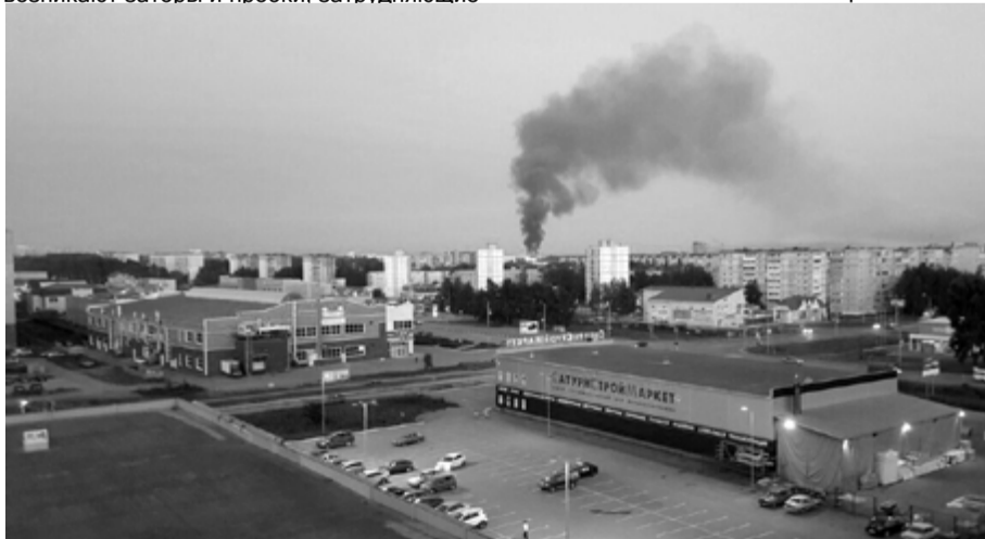
На фото: Столб дыма от пожара виден с Березовского шоссе